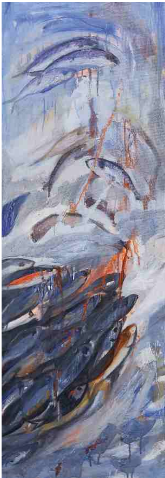
Σημάδια της Θάλασσας 5 , ΑΚΡΥΛΙΚΑ, 0.40 X 1.20 m , 2008