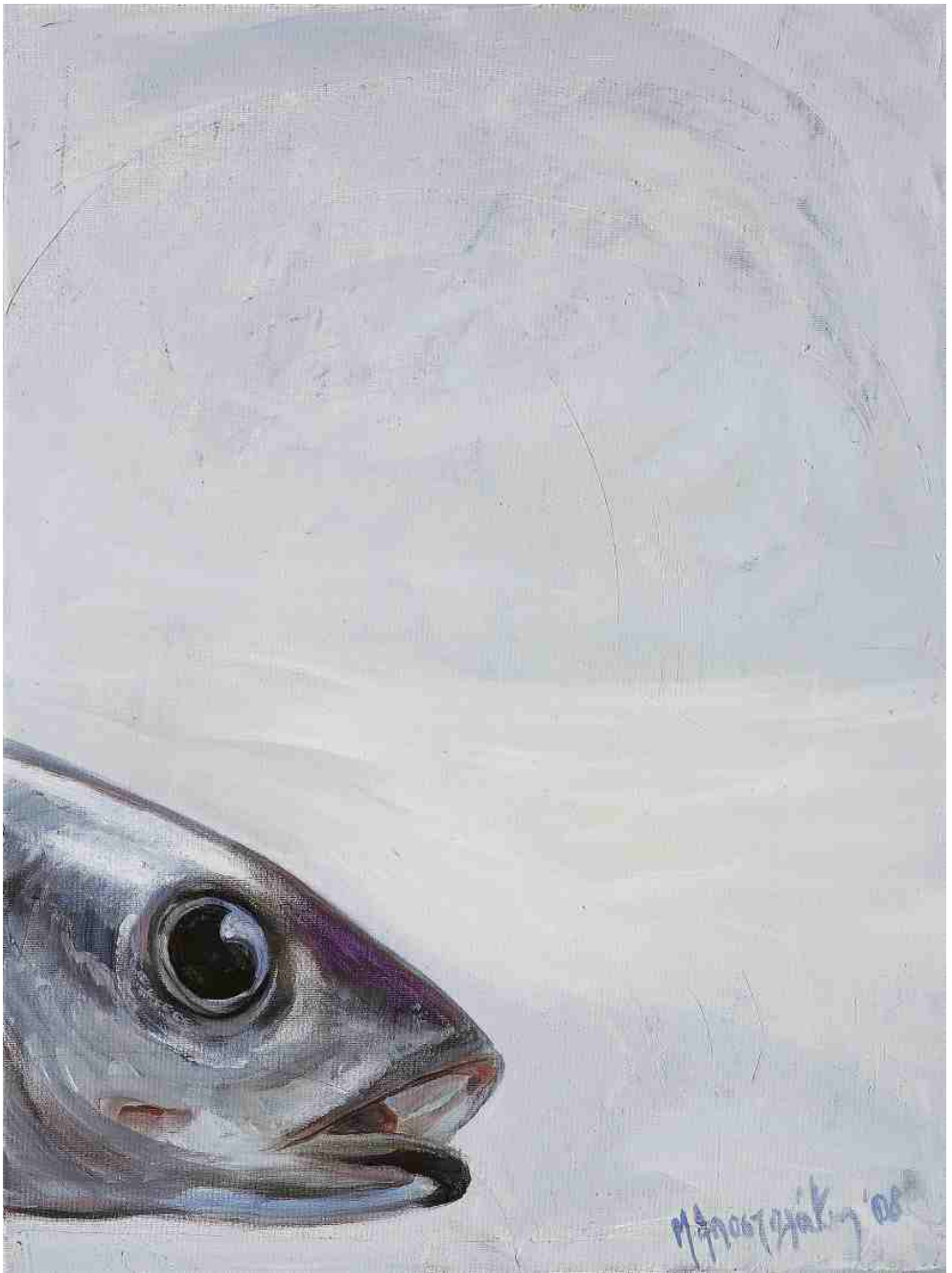
Εσωτερική σιωπή I, ΑΚΡΥΛΙΚΑ, 0.45 X 0.60 m , 2008