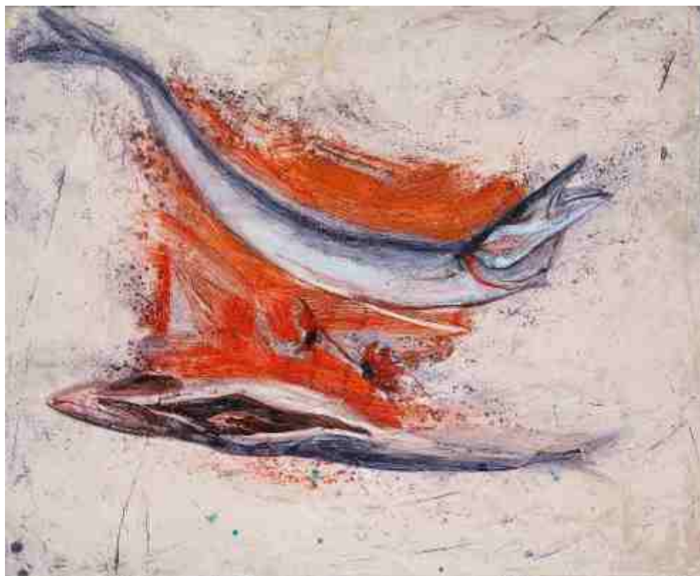
Ατύχημα ή έγκλημα II, ΑΚΡΥΛΙΚΑ, 0,45 Χ 0,55 m , 2007