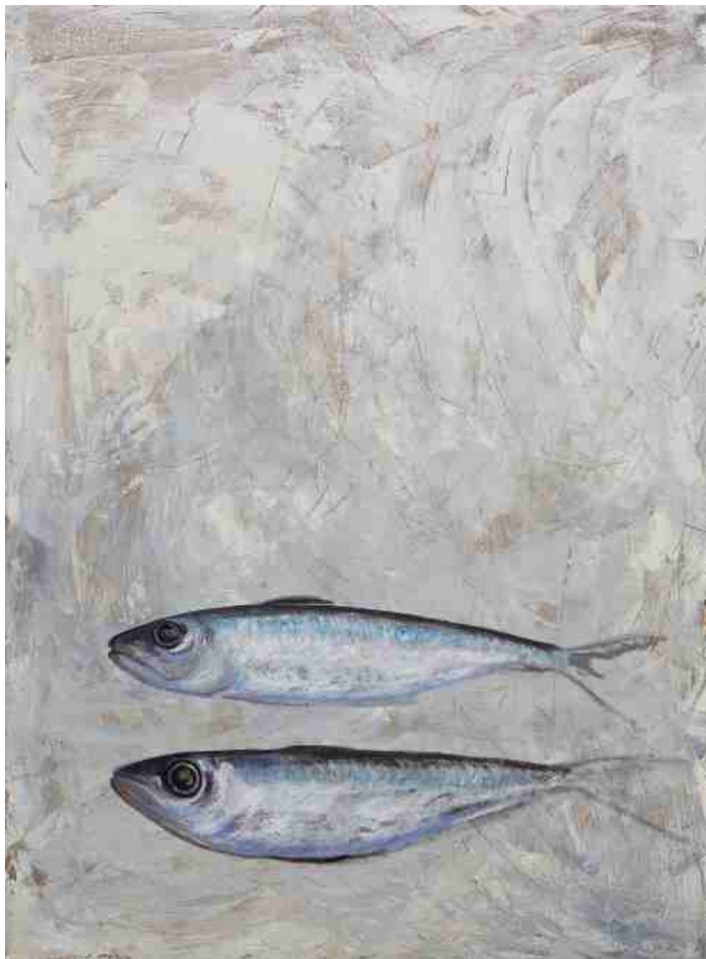
Αμφίπλευρη Σιωπή, ΑΚΡΥΛΙΚΑ, 1.00 X 1.40 m , 2008