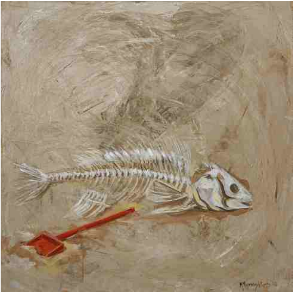
Το παιδί ξέχασε, ΑΚΡΥΛΙΚΑ, 1.00 X 1.00 m , 2008