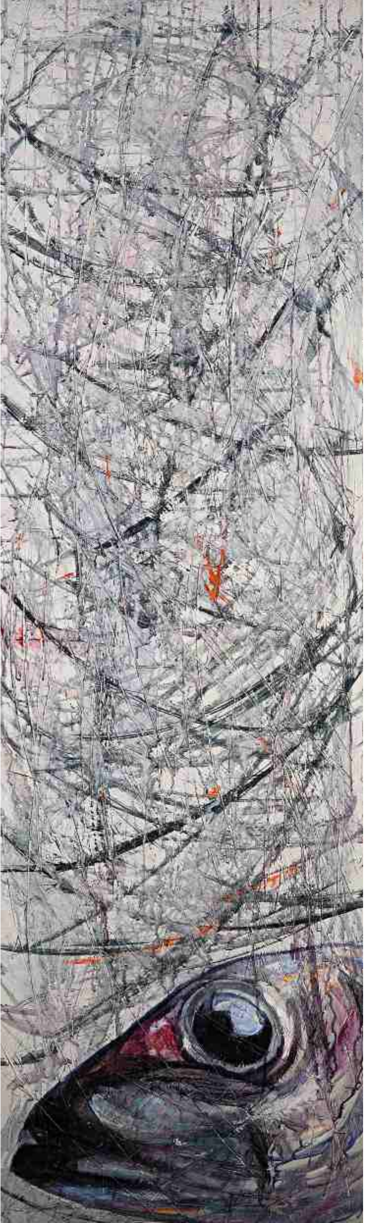
Σημάδια της Θάλασσας 6 , ΑΚΡΥΛΙΚΑ, 0,45 X 1,50 m, 2007