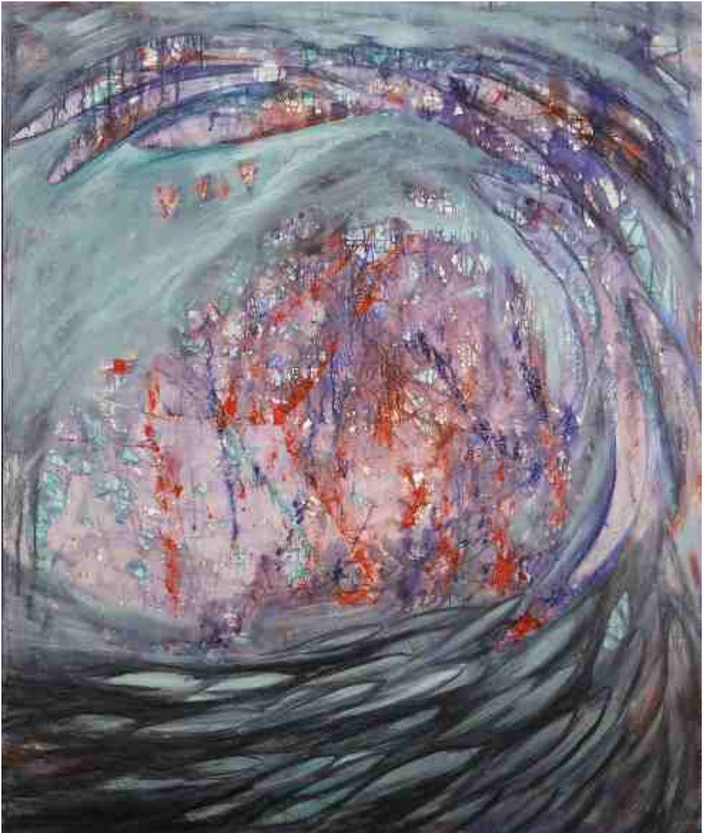
Μεγάλη Δίον Ι, ΑΚΡΥΛΙΚΑ, 1.50 X 1.80 m , 2007