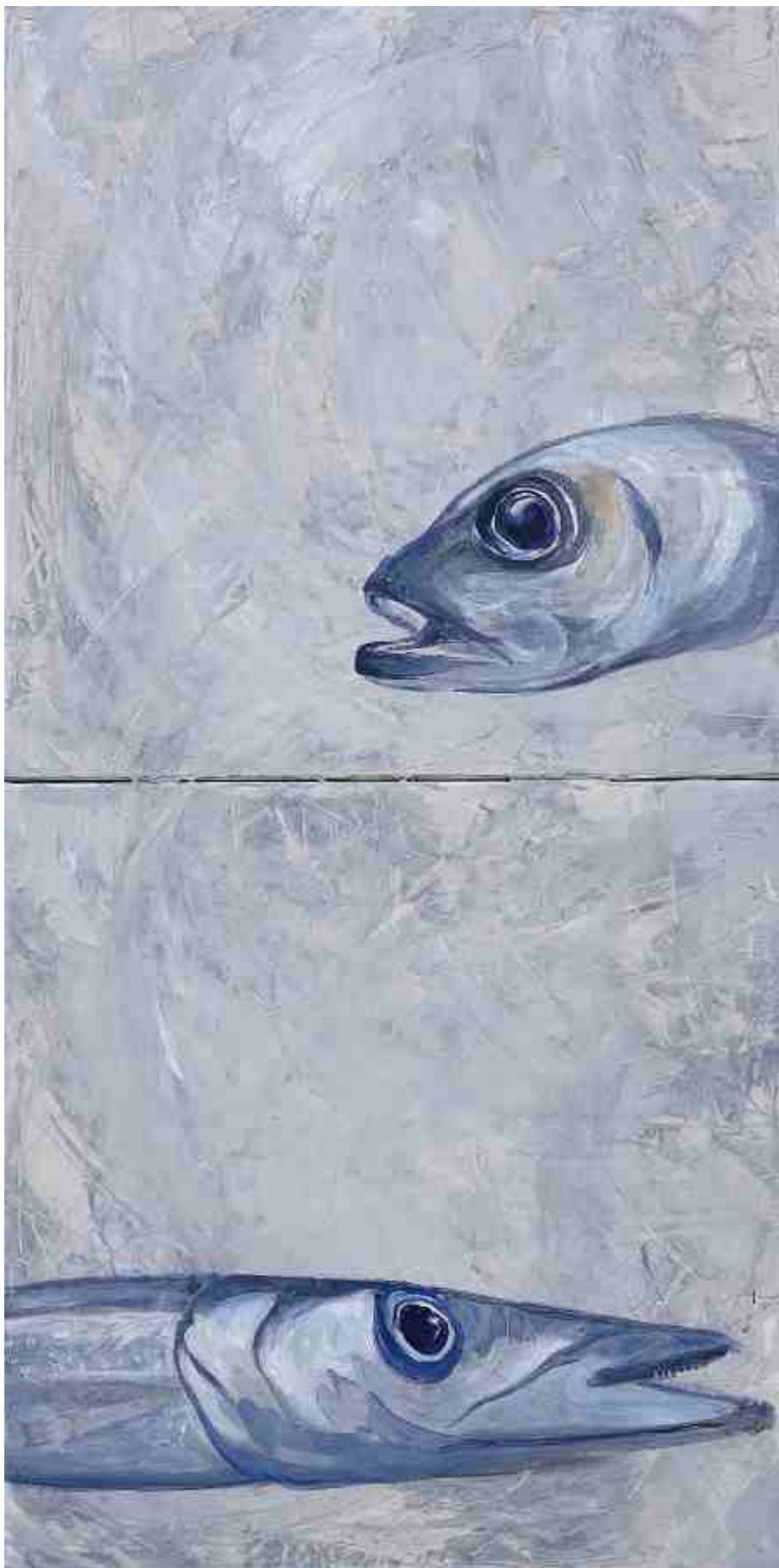
Δίπτυχο, Εσωτερική σιωπή II, ΑΚΡΥΛΙΚΑ, 2 X 0.45 X 0.45 m , 2008