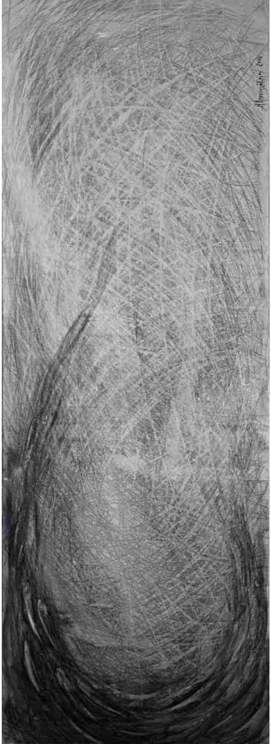
Рис. II, АКРИКА, 0,65 X 1,80 м, 2007