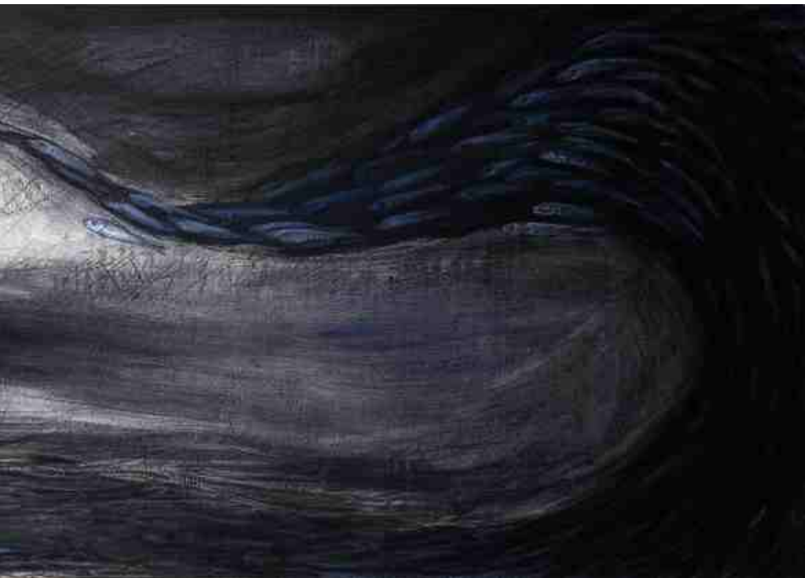
Άνοιγμα II, ΑΚΡΥΛΙΚΑ, 0.65 X 1.80 m , 2007