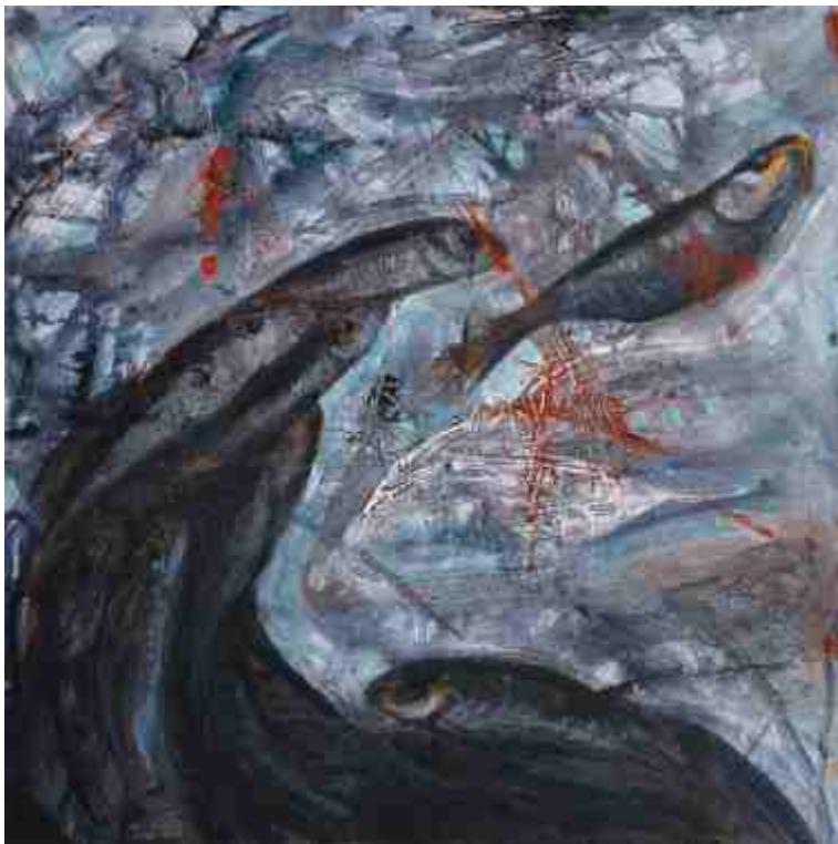
ΧΩΡΙΣ ΤΙΤΛΟ I & II, ΑΚΡΥΛΙΚΑ, 0.40 X 0.40 m , 2007