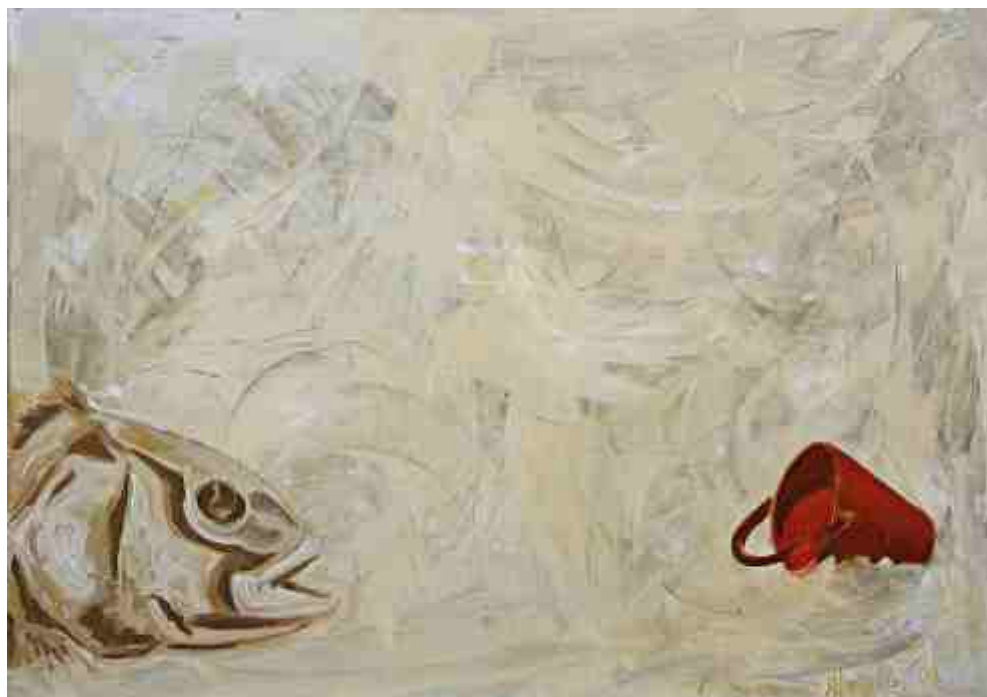
Κόκκινος κουβάς, ΑΚΡΥΛΙΚΑ, 1.00 X 1.40 m , 2008