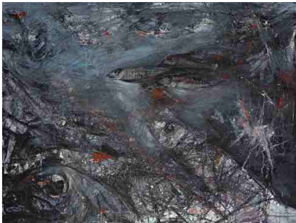
Πλοκή, ΑΚΡΥΛΙΚΑ, 0.60 X 0.80 m , 2007