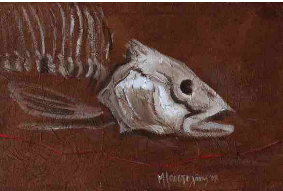
Κόκκινη κλωστή, Μικτή τεχνική, 0.40 X 1.20 m , 2008