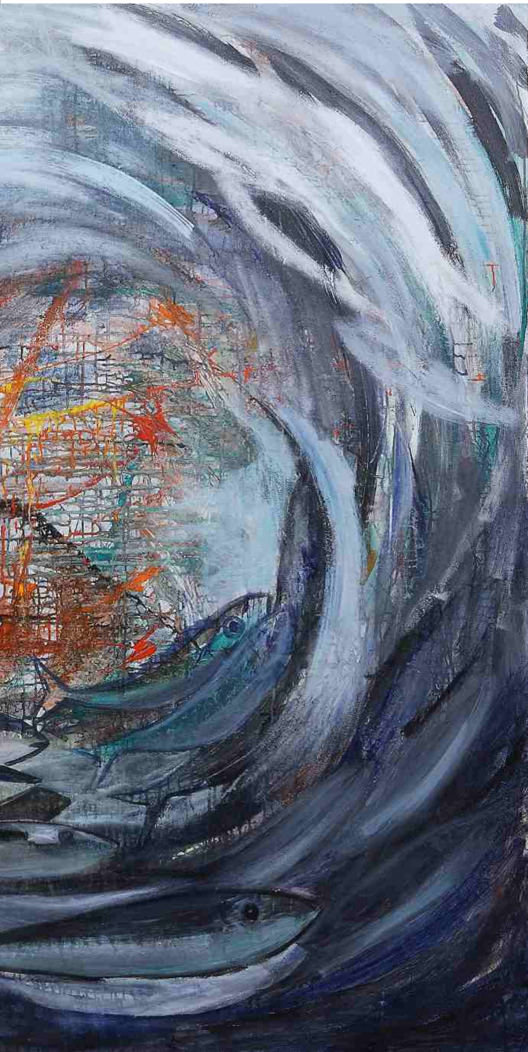
Μεγάλη Δίνη IV, ΑΚΡΥΛΙΚΑ, 1.80 X 1.80 m , 2008