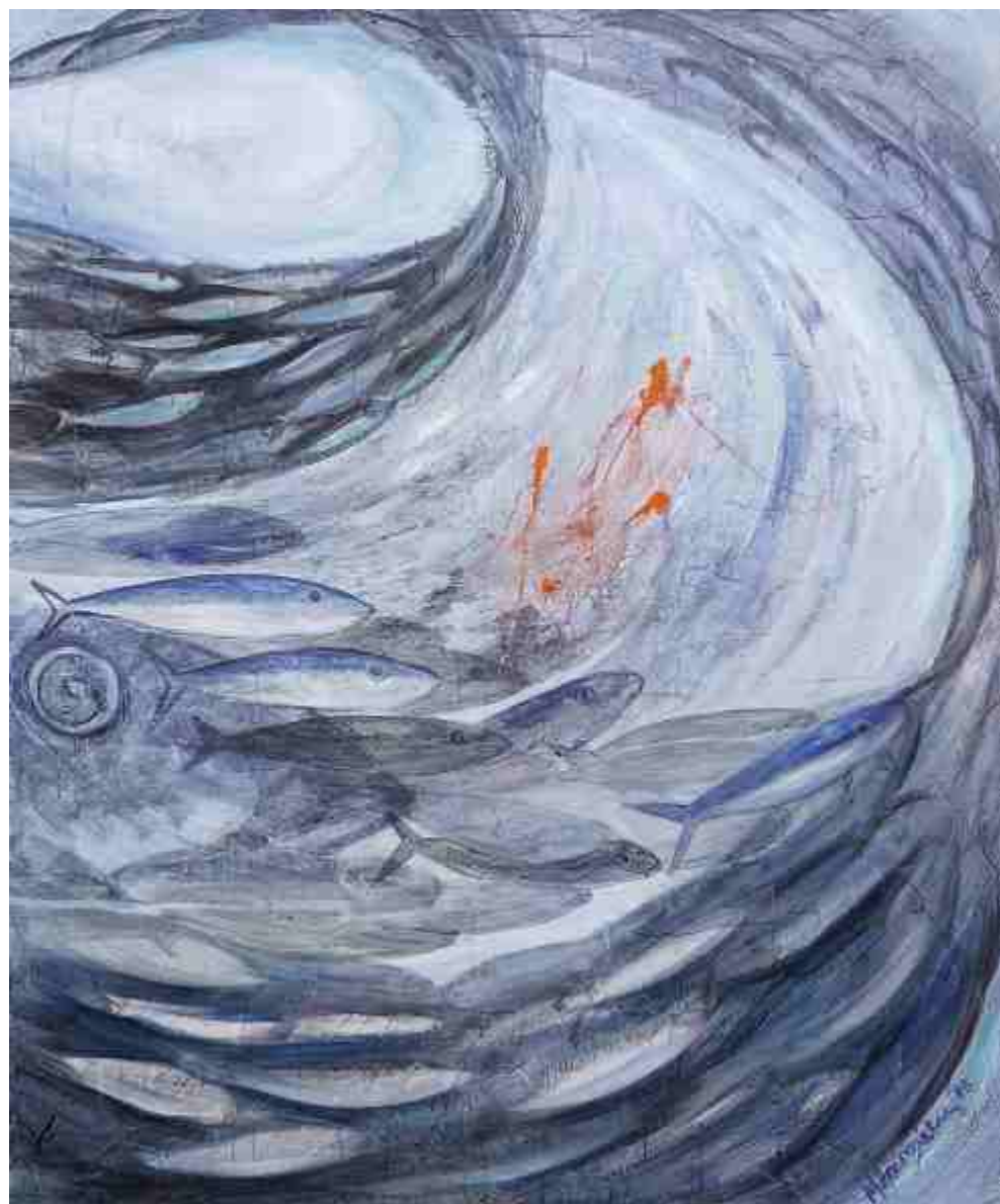
Μεγάλη Δίνη III, ΑΚΡΥΛΙΚΑ, 1.50 X 1.80 m , 2008