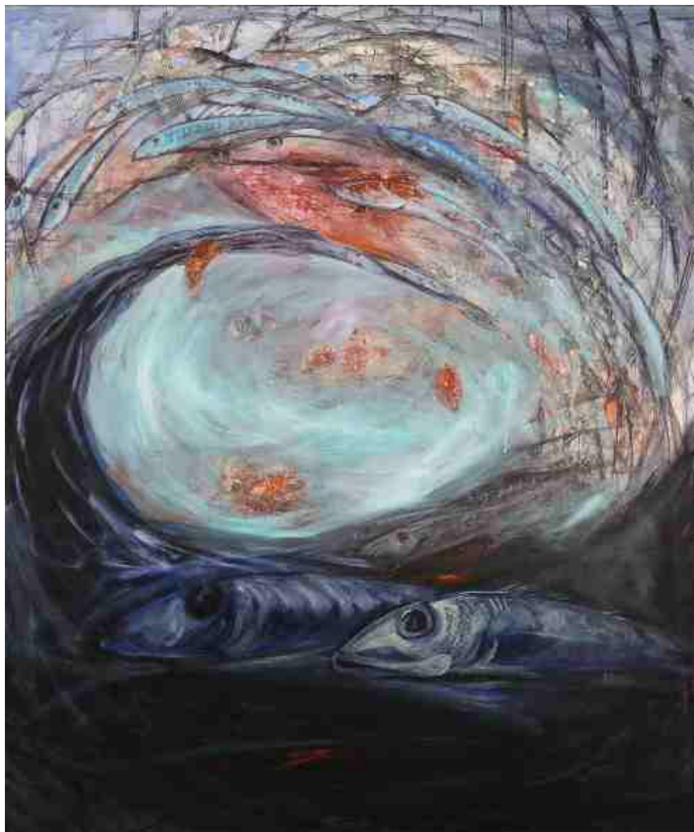
Μεγάλη Δίνη II, ΑΚΡΥΛΙΚΑ, 1.50 X 1.80 m , 2007