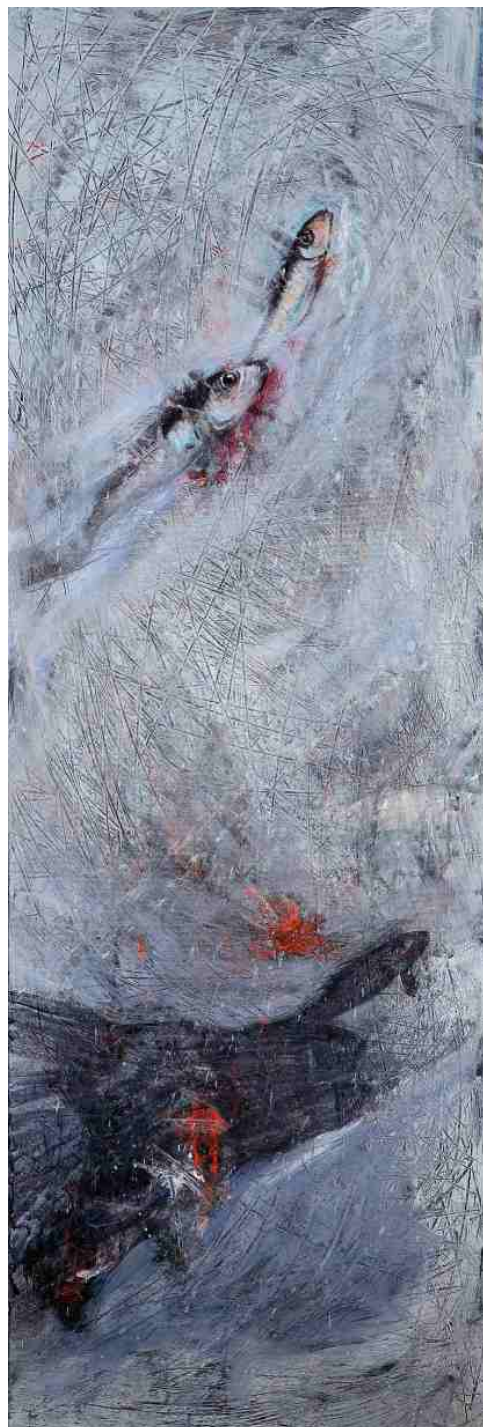
Σημάδια της Θάλασσας II & III , ΑΚΡΥΛΙΚΑ, 0.40 X 1.20 m , 2008